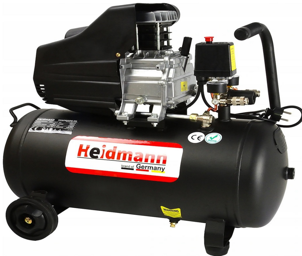
OLIECOMPRESSOR COMPRESSOR 50L 8bar HEIDMANN H00721

Een van de krachtigste 50 liter compressoren op de markt!