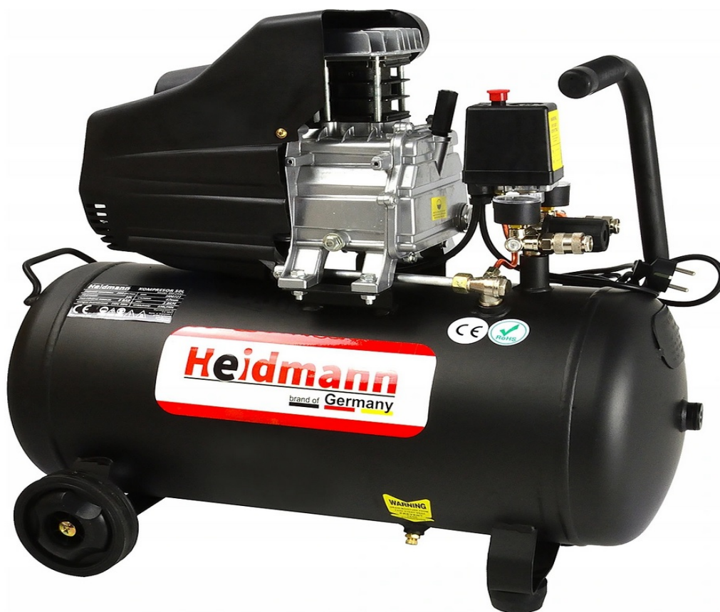
OLIECOMPRESSOR COMPRESSOR 50L 8bar HEIDMANN H00721

Een van de krachtigste 50 liter compressoren op de markt!